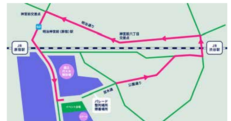
代々木公園出発～公園通り～神南一丁目交差点<右折>～渋谷スクランブル交差点～宮益坂下～明治通り～神宮前交差点～神宮橋交差点～代々木公園到着

(*1)フロートとは、パレードなどで利用される、カラフルに装飾したダシ(山車)のこと。